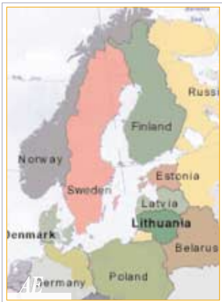
Lituania: dal 1° Gennaio 2004 il Paese entrerà a pieno titolo a far parte dell'Unione Europea.